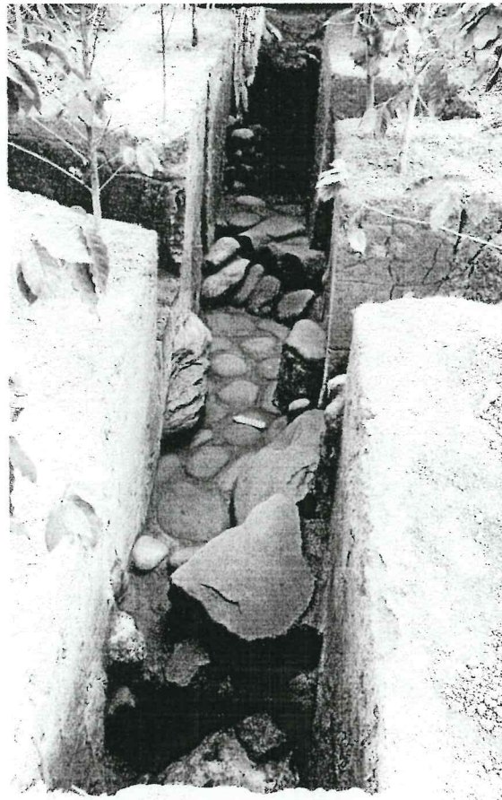
Figura 3. Vista general al este de los empedrados AA9g/9A (PANTA).